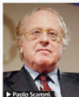
► Paolo Scaroni

MILANO Paolo Scaroni, amministratore delegato dell'Eni, è indagato dalla Procura di Milano per tangenti. L'inchiesta riguarderebbe una commessa da 11 miliardi di dollari in Algeria e una maxi tangente da 197 milioni di euro. Sotto la lente dei pm milanesi, Eni e Saipem: le due società quotate a Piazza Affari sarebbero indagate in base alla legge 231 che riguarda la responsabilità amministrativa degli enti. Gli uomini della Guardia di Finanza di Milano hanno perquisito la casa di Scaroni a Roma, la sede dell'Eni a San Donato Milanese e gli uffici di Saipem, alla ricerca di documenti. Da quanto emerge da ambienti inve-